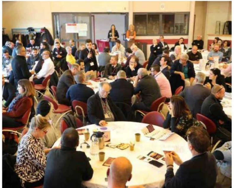
Hier, pour la création du groupe créonnais, des chefs d'entreprise n'appartenant pas au réseau BNI ont été invités à le découvrir.

Pour faire partie d'un groupe, les règles sont claires, il ne peut y avoir